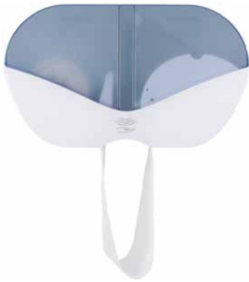
Zuverlässige Hygieneprodukte sind nicht nur in Corona-Zeiten gefragt