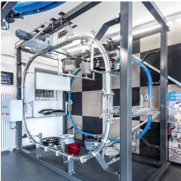
Paternoster – neuester Wurf aus dem Hause Kewesta; kompakte Anlage, die auf kleinem Raum große Leistung bringt