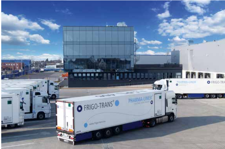
Bestens ausgestattet: Telematiksysteme sorgen für eine ununterbrochene Kühlkette

genommen. So konnten wir unsere Kernkompetenz der Pharmalogistik weiter ausbauen.“ Heute verfügt das Unternehmen mit 120 Beschäftigten und einem Umsatz von 33,8 Millionen EUR über eine Lagerfläche von einmal 18.000 m 2 (kundenspezifisch) und 13.500 m 2 (in Eigenbetrieb) und kann Produkte in drei unterschiedlichen Temperaturzonen lagern. So werden die pharmarelevanten Temperaturranges +2 °C bis +8 °C, +15 °C bis +25 °C und -25 °C abgedeckt.