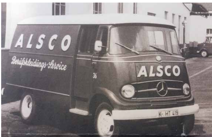
Die Zeiten ändern sich ...