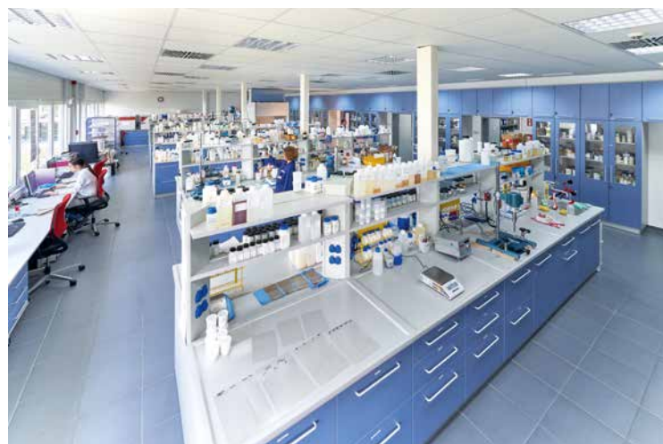
Die technische Ausstattung, einschließlich der Labore, ist immer auf dem neuesten Stand, um Kundenwünsche kompetent und schnell umzusetzen

Wirtschaftsforum: Herr Schenzle, was hat das Unternehmen zu dem gemacht, was es heute ist?