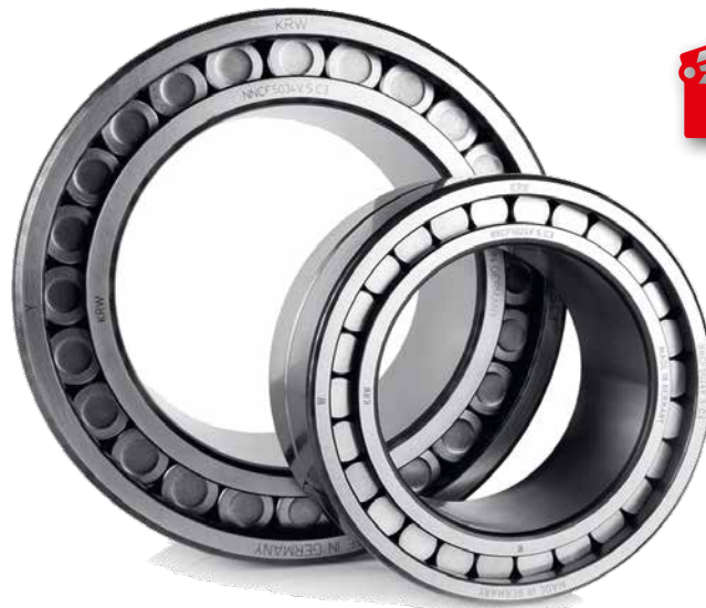
Die Zylinderrollenlager werden in Windkraftanlagen eingesetzt

Kugel- und Rollenlagerwerk Leipzig GmbH Gutenbergstraße 6 04178 Leipzig Deutschland ☎ +49 341 453200 ✉ +49 341 45320601 info@krw.de www.krw.de