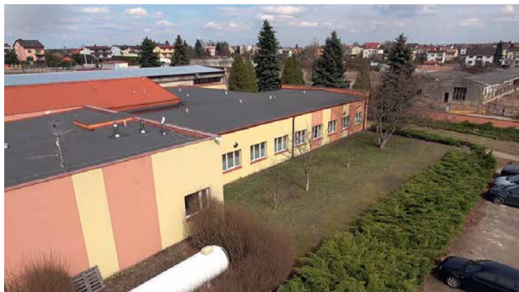
Der Hauptsitz des Unternehmens in Krakau, Polen

Veränderungen und neue Trends reagieren.“