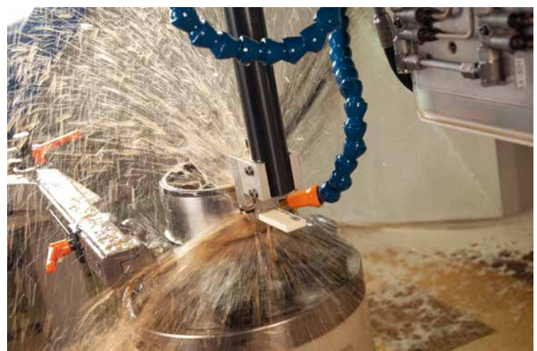
Rund 1.000 Produkte werden im Leipziger Werk hergestellt