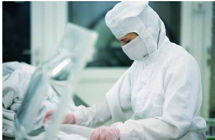
Professionelle Reinraumkleidung für größtmöglichen Schutz