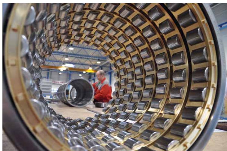
Für große Abmessungen: KRW fertigt Wälzlager aller Bauarten