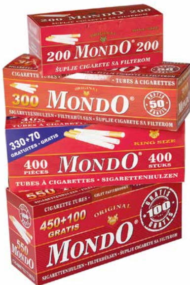
El Mondo ist ausschließlich auf Zigarettенfilter und -hüllen spezialisiert