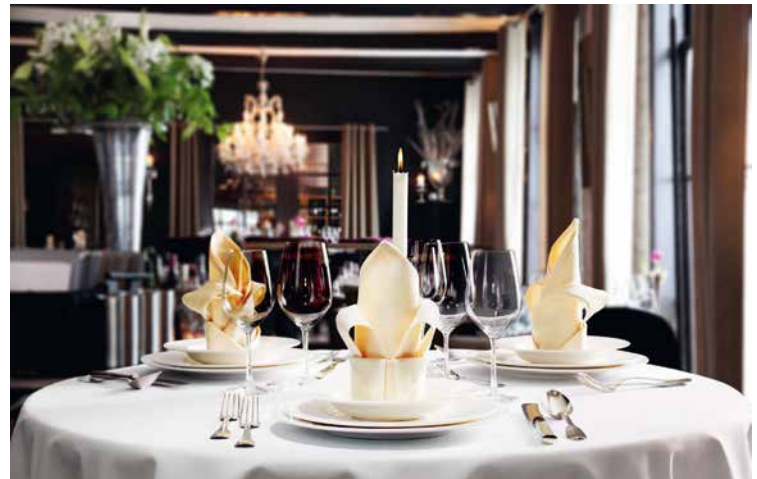
Auch wenn es um schöne Tischwäsche geht, ist AlSCO ein kompetenter Partner

viert. Die Aus- und Weiterbildung unserer Mitarbeiter spielt generell eine große Rolle. Für Führungspositionen setzen wir gerne auf eigenen Nachwuchs, rekrutieren aber ebenfalls Führungskräfte von außerhalb. Sehr lange Betriebszugehörigkeiten von der Ausbildung bis zum Ruhestand sind bei AlSCO keine Seltenheit. In Konzernen