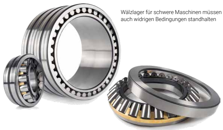
Wälzlager für schwere Maschinen müssen auch widrigen Bedingungen standhalten

Wirtschaftsforum: Wie lange begleiten Sie diesen Weg schon?