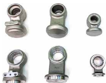
Schmiedeteile für den Maschinenbau und den Hydrauliksektor