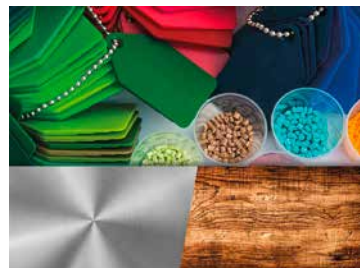
Kunststoff, Metall, Holz & Co.