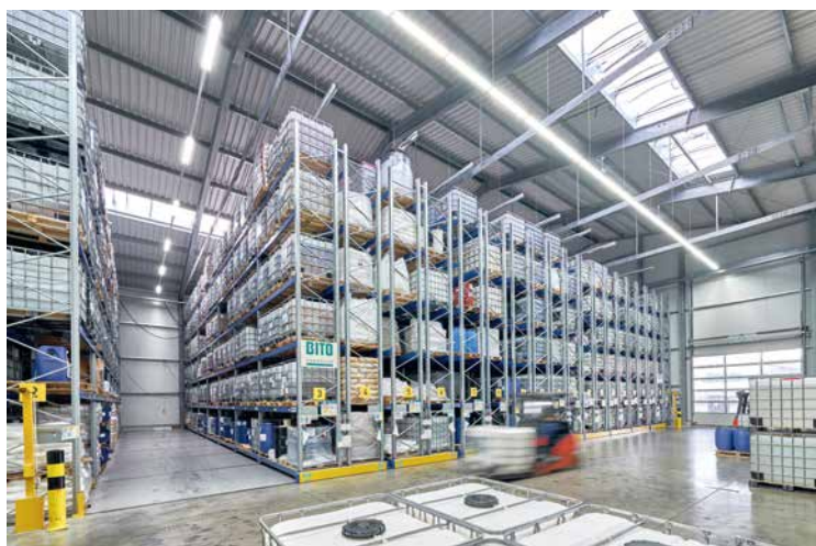
keim additec surface betreibt zwei hochmoderne Technologiezentren in Kirchberg und in Tübingen, wo rund 90 Mitarbeiter beschäftigt sind