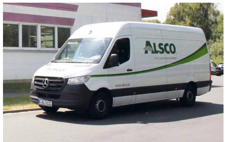
... bestimmte Dinge bleiben; zum Beispiel die schnelle und zuverlässige Belieferung der Kunden