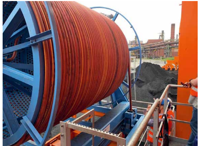
Die Produkte von TKD genießen einen ausgezeichneten Ruf für ihre Robustheit und Langlebigkeit

Segmentierung und Fokussierung vorantreiben Mobiles Arbeiten forcieren Thema Elektrifizierung ausbauen Teamwork und Transparenz stärken