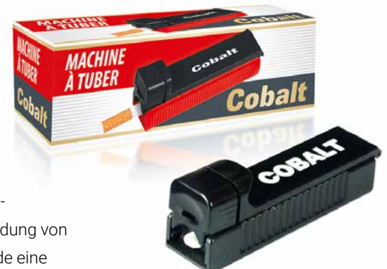
Auch Stopfgeräte gehören zum Portfolio des Unternehmens