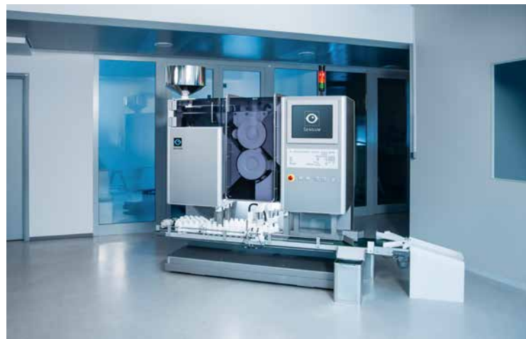
Einzigartig auf dem Markt: Sensums Spine Fibo vereint automatische visuelle Überprüfung, Zählen und Flaschenabfüllung von Tabletten, Kapseln und Softgelen