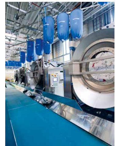
Die Reinigung der Wäsche ist besonders umweltfreundlich – weil Nachhaltigkeit in der AlSCO-DNA liegt