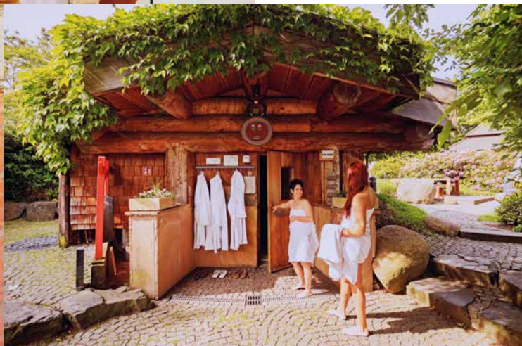
Die Anlage verfügt über die einzige Lehmsauna Deutschlands