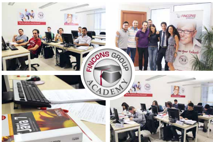
Fit für FINCONS: In der FINCONS GROUP Academy werden junge Universitätsabsolventen auf ihren Job vorbereitet