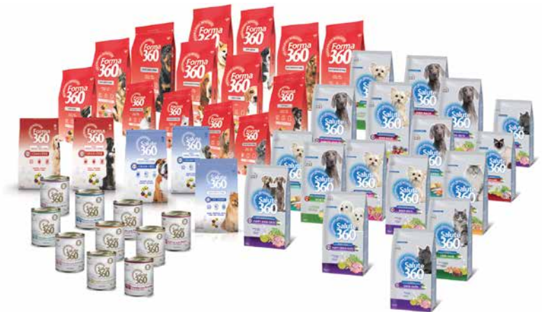
Gesundheit und Wohlbefinden beginnt im Napf mit hochwertigem Futter von Effeffe

Auf dieser Basis entwickelte sich Effeffe konstant weiter, fokussierte den Einzelhandel, kaufte 2009 die Anteile der Amerikaner zurück, erlangte so die Unabhängigkeit wieder und ebnete damit den