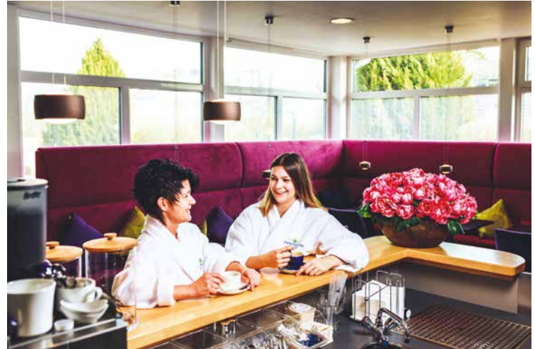
Im Bistro der Saunalandschaft Mona Lisa können Frauen ganz unter sich bleiben