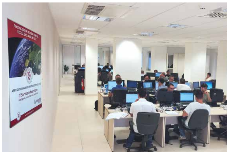
All in one: Im Delivery Center in Bari, Italien, werden nicht nur Softwarelösungen, sondern ganze Projekte entwickelt – professionell und kostengünstig