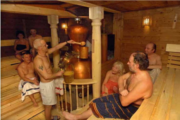
In der finnischen Sauna dreht sich alles um die traditionelle Destille aus Kupfer

eine Schwimmhalle wurden in den 1980er-Jahren angebaut, um den Kundenkreis zu vergrößern. Eigentlich sollte Hundertwasser die Hallen designen. „Dadurch haben wir das Ganze finanziert bekommen“, verrät