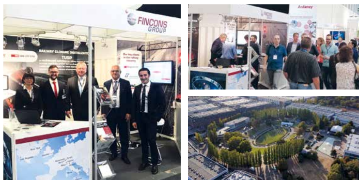
Zeit für neue Ziele: Auf der Fachmesse für Bahn- und Verkehrstechnik InnoTrans in Berlin präsentiert sich die FINCONS GROUP weltoffen und innovativ

in andere Märkte exportiert und nachdem weitere Firmensitze in Italien und der Schweiz etabliert waren, eröffneten wir 2016 ein Büro in London sowie 2017 zwei Büros in den USA. Und wir wer-