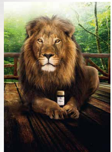
Mit scharfem Blick für vollendeten Geschmack: Der Löwe steht für die Marke GEMARA