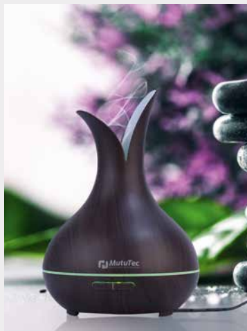
MutuTec-Luftfrischer – jüngste Eigenmarke mit großem Potenzial

Technik und wenig Manpower zu arbeiten. Wir haben in 20 Jahren umfassendes Know-how aufgebaut und können einschätzen, wie der Markt tickt. Diese Erfahrung