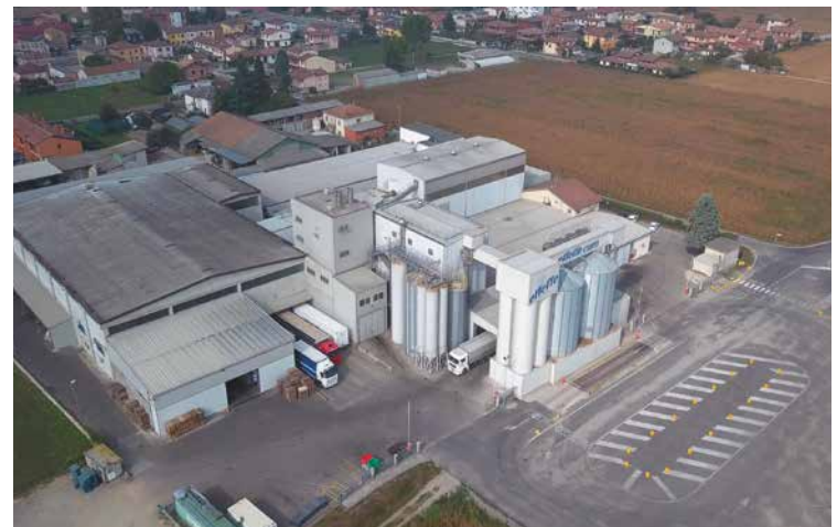
Mehr als 30 Jahre Erfahrung, mehr als 80 Mitarbeiter und Produkte mit Mehrwert – das ist Effeffe Pet Food aus der Nähe von Mailand