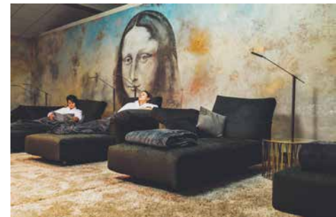
Der luxuriöse Ruheraum mit Porträt der Mona Lisa

So können sie ungestört in eine Atmosphäre eintauchen, die sie zu Hause oft nicht haben. Und das, wann immer sie möchten, denn in 40 Jahren war der Betrieb nicht einen Tag geschlossen.