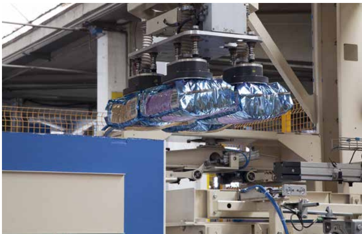
60.000 t Tierfutter im Jahr werden hier gefertigt, flexibel nach Kundenwunsch und auf der Basis von Rezepturen, die von der Universität Bologna bewertet werden

Eine gezielte Forschungs- und Entwicklungsarbeit ist für Effeffe Voraussetzung, um interessante Produkte auf den Markt bringen zu können – Produkte mit Mehrwert.