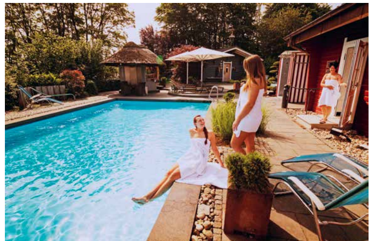
Der asiatisch inspirierte Außenbereich lädt zu einem entspannenden Bad ein