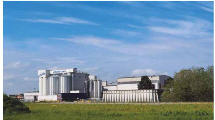
Effeffe: der zuverlässige Futterlieferant aus der Lombardei