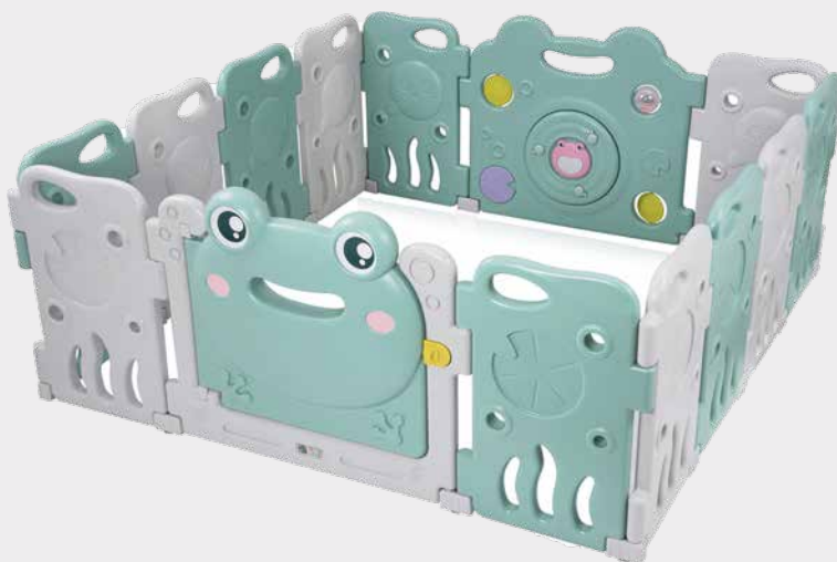
Outdoor-Laufgitter der Marke 'Baby Vivo' – gefragtes Angebots-Highlight

und Dekoartikel, MAXCRAFT für Baumarktartikel, GAJO für Sanitärprodukte, Strattore für Gartenartikel, MutuTec, die jüngste Marke, für Elektronikartikel, die künftig einen noch größeren Stellenwert einnehmen sollen, und MA Trading für jene Produkte, die nicht eindeutig kategorisiert werden können. Die Palette ist breit und bietet einiges an Highlights.