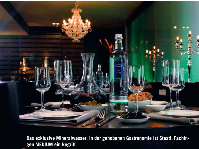
Das exklusive Mineralwasser: In der gehobenen Gastronomie ist Staatsl. Fachingen MEDIUM ein Begriff

Gastronomie und Top-Hotellerie im High End-Level sind weitere Zielgruppen. Staatsl. Fachingen MEDIUM ist eines von drei nationalen deutschen Mineralwässern.