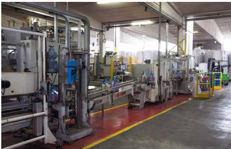
Ein hoher Automatisierungsgrad ist wichtig, um wettbewerbsfähig zu bleiben

Kunden müssen sich darauf verlassen können, Qualitätsprodukte und -services zu bekommen. Top-Produkte zu attraktiven Preisen und das Ganze pünktlich.