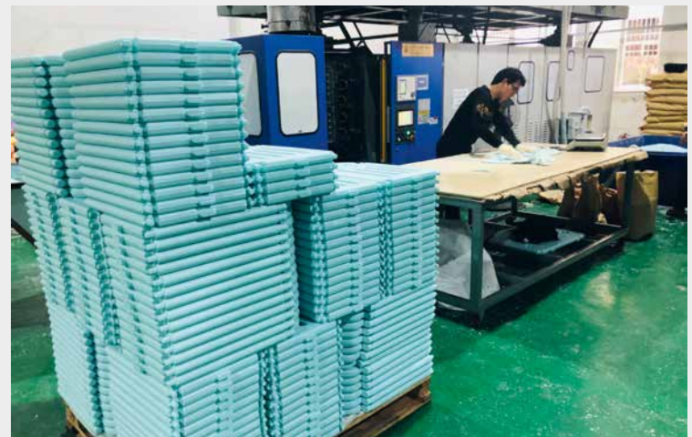
In China wird produziert, gelabelt und getestet